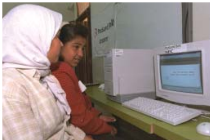
Muchachas beduinas frente a una computadora distribuida como parte del programa "Una computadora para cada niño"