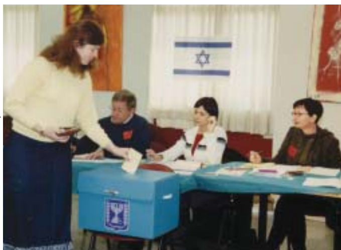
Una votante deposita su voto en las elecciones nacionales