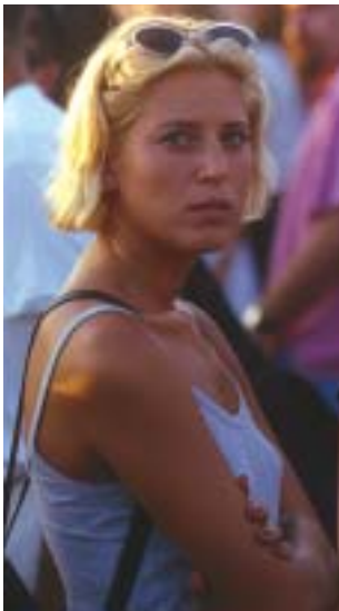
Ministerio de Relaciones Exteriores de Israel

La Declaración de Independencia de Israel fue uno de los primeros documentos constitutivos del país que garantizó igualdad política y social sin discriminación de sexo. En 1951 la Knéset aprobó la Ley de Igualdad de Derechos de la Mujer que, aunque concede autoridad constitucional a los tribunales para anular una legislación, fue utilizada como instrumento interpretativo por la Corte