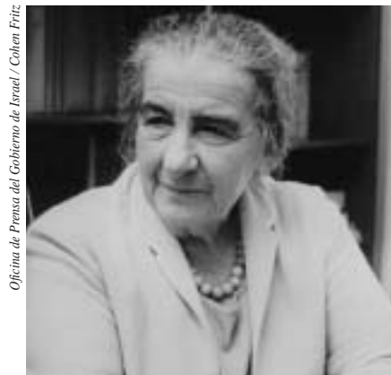
Ex Primera Ministro Golda Meir