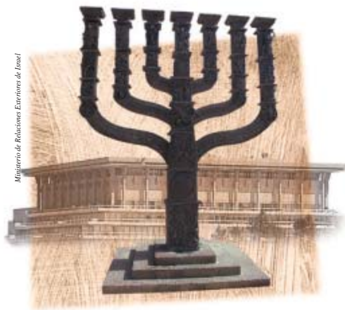
Ministerio de Relaciones Exteriores de Israel

Junto a las más tempranas expresiones de conceptos humanitarios y pluralistas, las instituciones judías mismas se adhirieron a ciertas formas de lo que posteriormente pasaron a ser expresiones de la democracia moderna. Las antiguas comunidades judías durante el período del Talmud y después del mismo, en Israel como en la diáspora, fueron gobernadas por entes representativos electos por cada comunidad (Kehilá), separados de los Batéi Din (cortes judías) religiosos. Estas entidades eran electas por las comunidades en las que se desempeñaban y supervisaban todas las actividades sociales de la comunidad. El cuidado del bienestar de todos los miembros de la comunidad, especialmente de las viudas, los huérfanos y los pobres, era una de las principales preocupaciones de estas instituciones comunitarias, práctica que ha sido traducida en el moderno sistema democrático de Israel en una política de bienestar social.