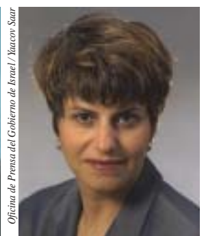
Ministra Dalia Itzik