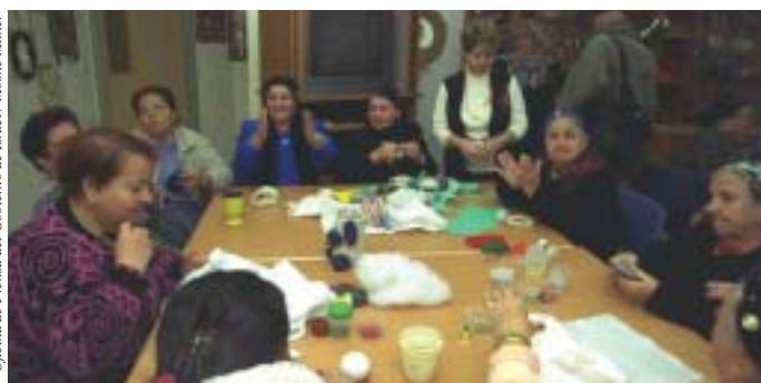
Mujeres en un Centro para ciudadanos mayores en el pueblo de Shlomi