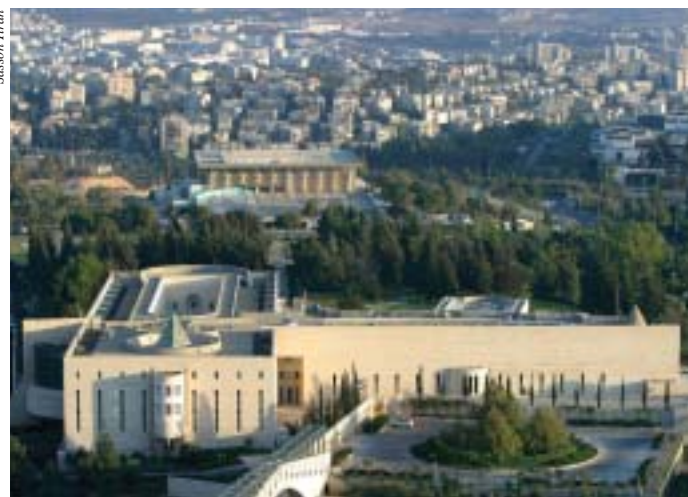
El edificio de la Corte Suprema de Justicia, con la Knéset en el fondo

En materias de status personal, como ser matrimonio, divorcio y manutención, tutoría y adopción de menores, la jurisdicción está entregada a las instituciones judiciales de las respectivas comunidades religiosas: tribunales rabínicos, cortes religiosas musulmanas (las cortes de sharía), cortes religiosas drusas; y las instituciones jurídicas de las comunidades cristianas reconocidas en Israel.