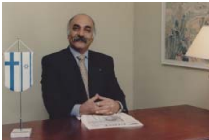
Diplomático Ali Yahya, el primer embajador árabe israelí

Ministerio de Relaciones Exteriores de Israel