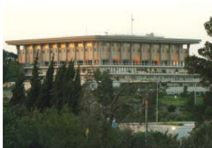
El edificio de la Knéset

Los partidos representados en la Knéset saliente pueden automáticamente ser reelectos; partidos nuevos pueden presentar listas de candidatos obteniendo las firmas de 2.500 votantes que puedan ser elegidos y haciendo un depósito que les es reembolsado si logran por lo menos el 1,5 por ciento de la votación nacional, que les otorga una banca en la Knéset.