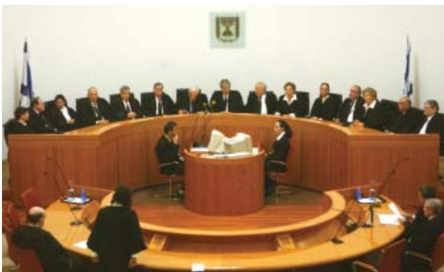
Jueces de la Corte Suprema en sesión