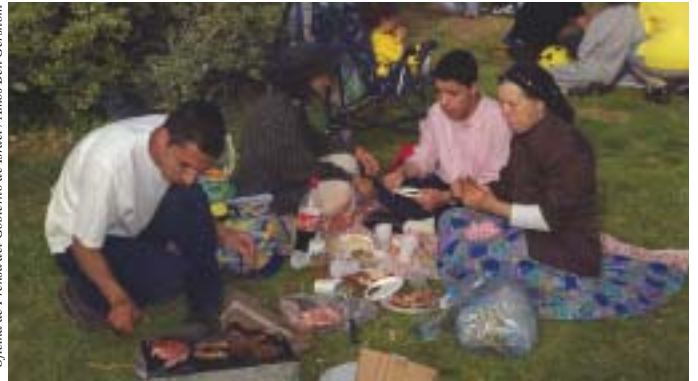
Una familia judía celebrando la fiesta de la Mimuna