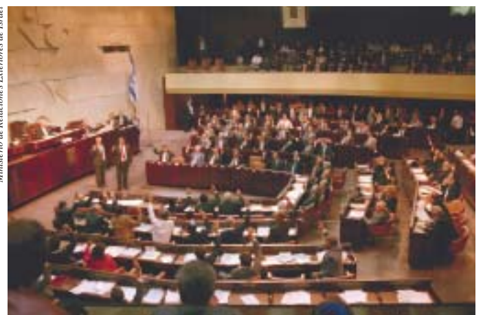
Ministerio de Relaciones Exteriores de Israel