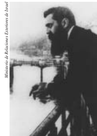
Ministerio de Relaciones Exteriores de Israel