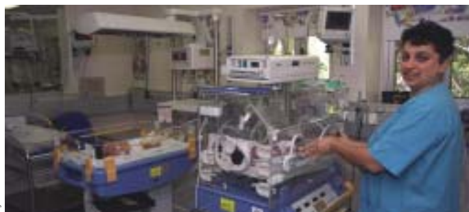
Pabellón de prematuros en el Hospital Wolfson en Holón