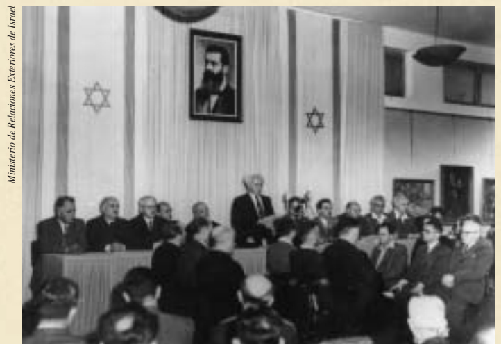
David Ben-Gurión, el primer Primer Ministro de Israel, proclamando la independencia de Israel