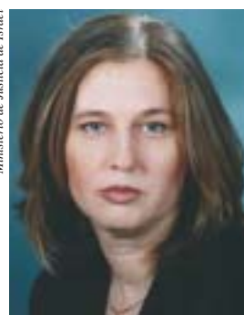
Ministra Tzipi Livni

Ministerio de Educación y Cultura de Israel