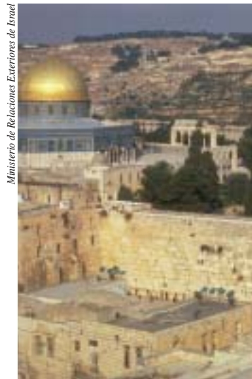
El Muro Occidental, uno de los lugares judíos más sagrados, debajo del Domo de la Roca, lugar santo para los musulmanes

Dado que el propósito declarado de Israel es servir principalmente como patria del pueblo judío, se ha debatido mucho acerca del papel que debería jugar la religión en la