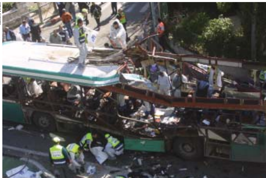
Escena de un ataque terrorista a un autobús urbano

sus ciudadanos, sino que también ha tenido que afrontar una guerra en los medios de comunicación que se lucha para ganar la opinión pública tanto en la arena nacional