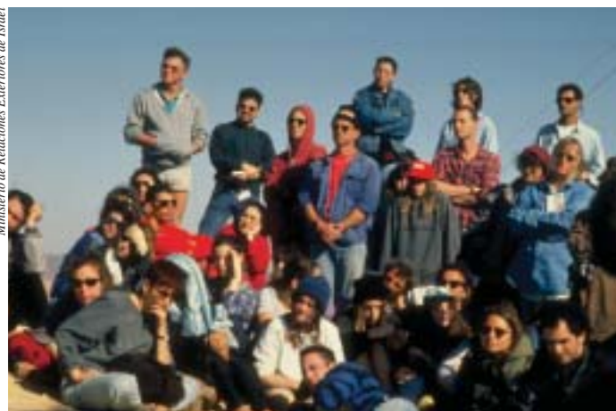
Ministerio de Relaciones Exteriores de Israel

Se llevó a cabo una encuesta de opinión entre la población más joven, en parte para obtener una visión de lo que se puede prever de la futura generación. Alentadoramente, el estudio encontró que la juventud israelí está más satisfecha que la población adulta con las instituciones políticas nacionales y el funcionamiento de la democracia en Israel. La generación joven demuestra una mayor conciencia respecto a las libertades y las tendencias antidemocráticas, como las restricciones a la libertad de expresión. De esta manera, la democracia parece ser vista cada vez más como una forma de vida intrínseca y apreciada en Israel, y como tal será salvaguardada en el futuro.