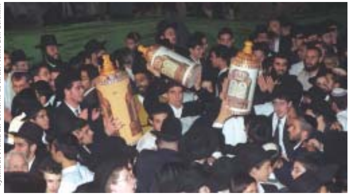
La festividad judía de Simjat Torá