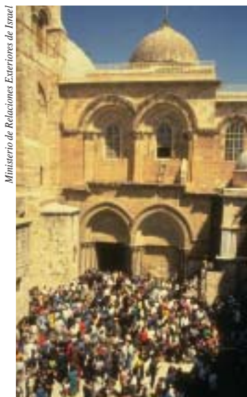
La Iglesia del Santo Sepulcro en Jerusalem

aplicación de la ley religiosa en asuntos personales y el financiamiento estatal para las escuelas religiosas son ejemplos de la participación de la religión en asuntos de Estado en Israel.