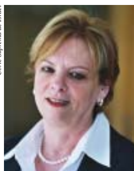
Jueza de la Corte Suprema Dorit Beinisch