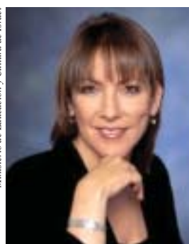
Ministra Limor Livnat

Ministerio de Educación y Cultura de Israel