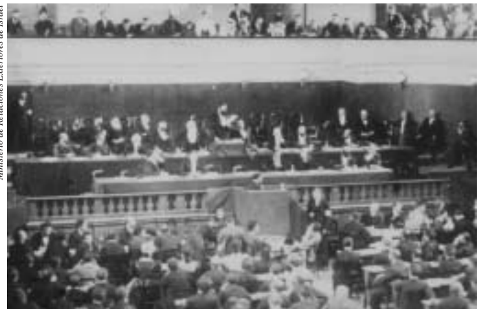
Ministerio de Relaciones Exteriores de Israel