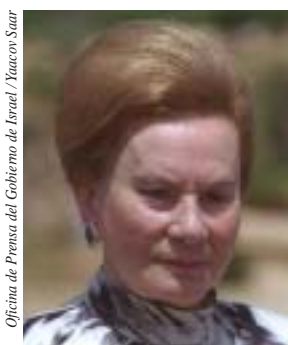
Ex Contralor del Estado y Ombudsman Miriam Porat