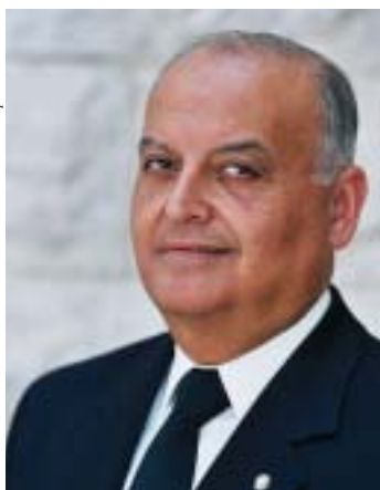
Juez de la Corte Suprema Salim Joubran

El sector árabe ha pasado a ser más prominente en lo político en los últimos años. Por primera vez, fue nombrado un juez árabe en la Corte Suprema y han servido en el gobierno vice ministros árabes. Ciudadanos árabes sirven en el servicio exterior de Israel como diplomáticos y embajadores representando al país.