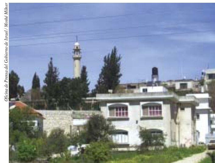
Oficina de Prensa del Gobierno de Israel / Mosié Míhner