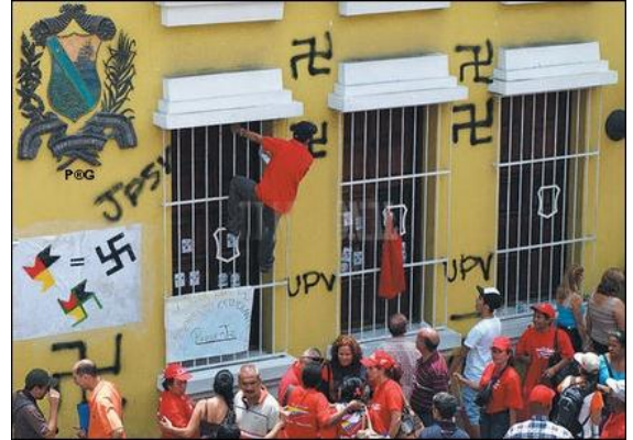
Grafiti pintado en la casa de la Gobernación del Estado Miranda tras una manifestación liderada por un alcalde del PSUV, partido de gobierno.