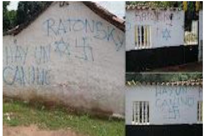
Ratonski [Ratón] al lado de Esvásticas y Estrellas de David “Hay un Canino” es una distorsión del logo de la campana de Capriles “Hay un Camino”

No importa lo que los miembros de esa RELIGION HAYAN SUFRIDO NI POR LO QUE HAYAN PASADO .NADA...NADA JUSTIFICA EL CRIMEN Y EL ASESINATO DE OTROS SERES HUMANOS. Menos cuando lo practica un grupo religioso que FUE VICTIMA DE ESA SITUACION. LO QUE LO INDUCE PENSAR QUE: ...O NO APRENDIERON,... O QUIEREN VER EN OTROS EL SUFRIMIENTO QUE EL DESTINO LES CAUSO A ELLOS...Me quedo con LOS HUMANISTAS que buscan el BIENESTAR Y LA PAZ PARA TODOS SIN DISTINGOS RELIGIOSOS.Me quedo con los SOCIALISTAS, así de sencillo.¿Que busca Israel en Venezuela?