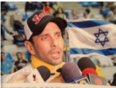
Capriles posando en una foto montada pretendiendo que posa frente a una bandera Israeli

“...Henrique Capriles Radonsky es tanto el candidato de la derecha “venezolana” apéndice del imperialismo estadounidense, como también del sionismo internacional. Su origen religioso y formación política judío-sionista lo convierte en el centro preferido de todas las apuestas y en centro confiable del financiamiento no sólo de la burguesía local y la acaudalada comunidad israelita organizada en Venezuela, sino de los grandes lobbys sionistas mundiales. Esta situación de dominio de un extranjero no intimida ni hace sentir reemplazada a la burguesía criolla del país, aunque si en cierta medida a la vieja clase política que siempre ha dominado...”